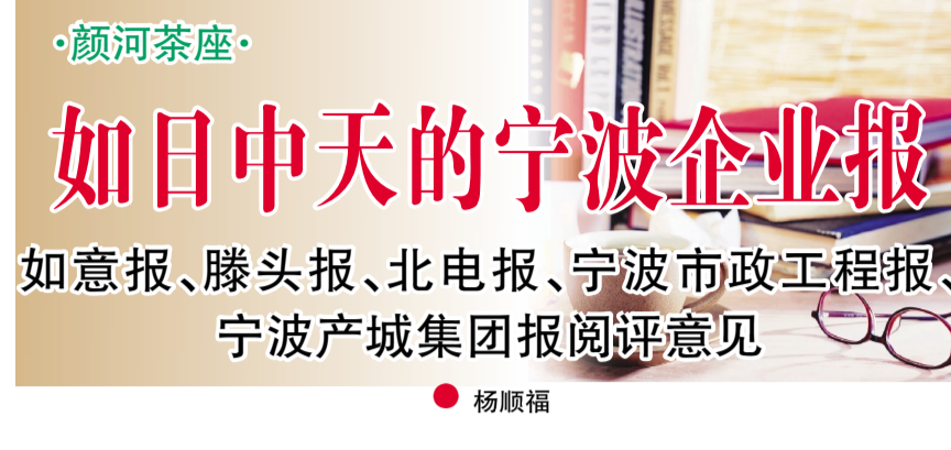
·颜河茶座· 如意报、滕头报、北电报、宁波市政工程报、宁波产城集团报阅评意见